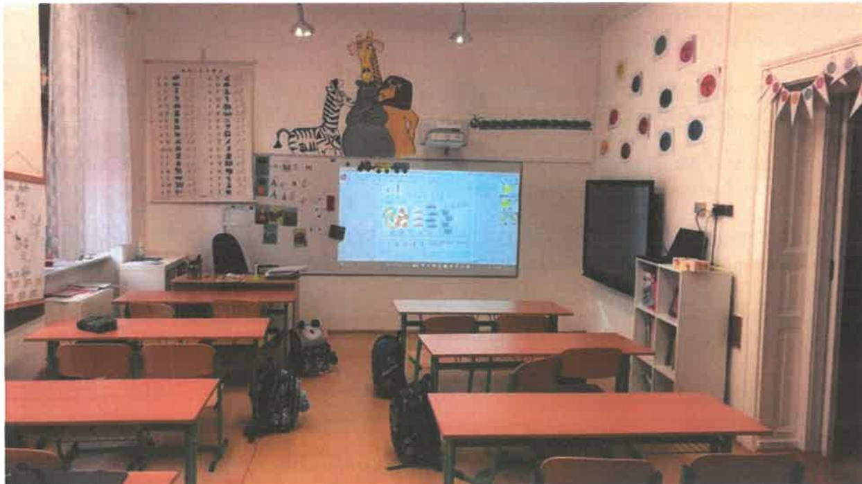
Aktuální foto z nového školního roku 2024/2025.

Ačkoliv je veškerá dešťová voda odváděna mimo budovu školy, dochází k vlhnutí především v tělocvičně a staré šatně. Pan školník tak v létě opravil několik metrů čtverečných omítek a udělal výmalbu i v těchto místnostech.